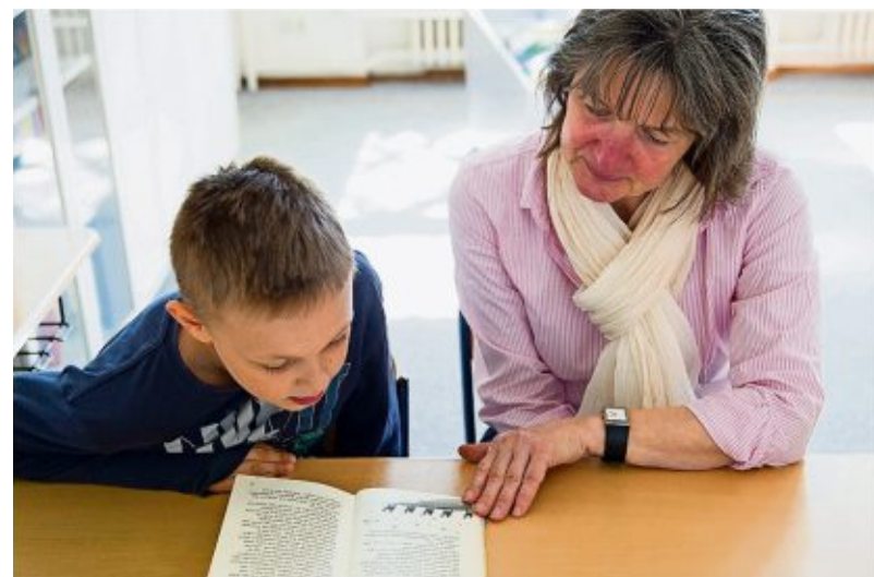
Wer gut lesen kann, hat es im Leben leichter. Die Grund- und Förderschulen wünschen sich deshalb Lesepaten für die Kinder.

Die Lesepaten brauchen nicht mehr mitzubringen als die Lust, mit den Grund- oder Förderschü-