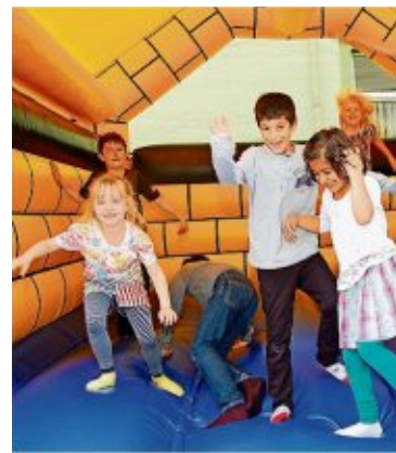
Unter anderem wird es bei dem Fest in Einswarden eine Hüpfburg geben.

Jeder ist dazu eingeladen, bei dem Kinder- und Familienfest vorbeizuschauen. (kzw)